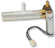
EXPANSION MODULE EM-AUTOZERO