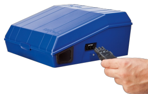
CONNECTION SOCKET FOR LIGHTING