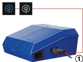
BUTTONS ON THE CONTROL PANEL TO SWITCH THE LIGHTING ON/OFF