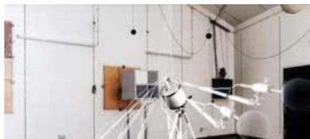
ЗМЕРВАНИЯ НА ЛУМОЗАГЛУШИТЕЛИ КУСТИКА