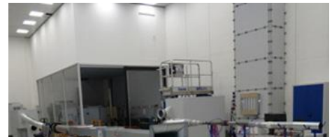
ИЗПИТВАТЕЛНИ СЪОРЪЖЕНИЯ ТЕХНИЧЕСКИ СРЕДСТВА ЗА КОНТРОЛ