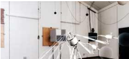
ЗМЕРВАНИЯ НА ЛУМОЗАГЛУШИТЕЛИ КУСТИКА